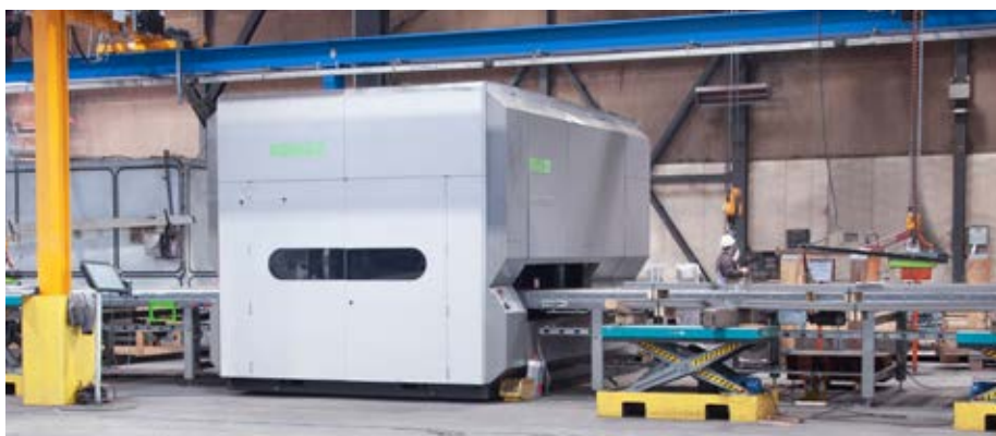
Rund 400 Tonnen Material werden bei DEUMU monatlich im Schnitt gerichtet.

Mit der seit Jahren erfolgreichen Baureihe Peak Performer bietet KOHLER für zahlreiche Anwendungen leistungsfähige und energieeffiziente Teilerichtmaschinen an. Diese werden insbesondere für das Richten von Teilen, Zuschneiden und auch ganzen Blechtafeln eingesetzt.